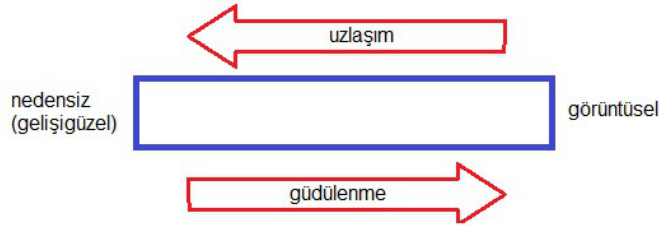
Şekil 1: Güdülenme Ölçeği (Fiske, 2014, 143)

fotoğrafi yağlı boya portresinden daha fazla güdülenmiş bir göstergedir. Kişinin karikatürü ise yağlı boya portresinden daha az güdülenmiştir. Tuvalet kapılarında erkek-kadın göstergeleri insan karikatürlerinden “♂” ve “♀” işaretleri ise tuvalet kapılarında erkek-kadın göstergelerinden daha az güdülenmiş göstergelerdir (Fiske, 2014, 139-144). Bir göstergede güdülenme ne kadar az ise toplumsal uzlaşım o kadar fazla olmaktadır. Bunun sebebi az güdülenmiş bir göstergenin ciddi bir soyutlama ya da simge olup, kültürel düzlemde uzlaşmaya bağlı oluşmuş olmasıdır. Göstergede güdülenme azaldıkça uzlaşım artmaktadır.