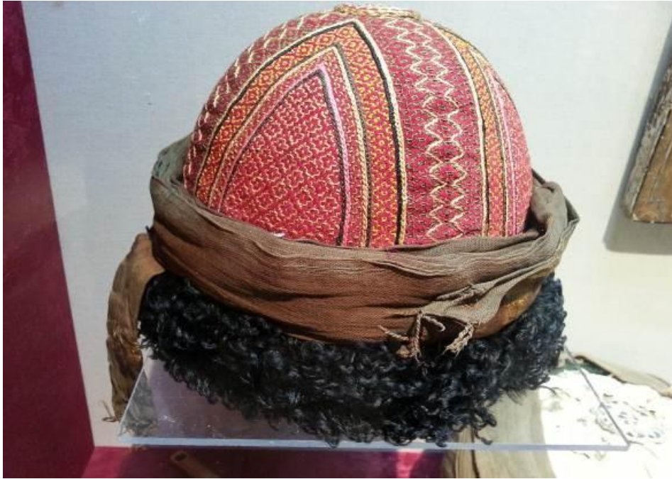
Res. 24: Halen Okmeydanı Okçular Tekkesi'nde teşhir edilmekte olan müjgânlı bir tarikat tacı.