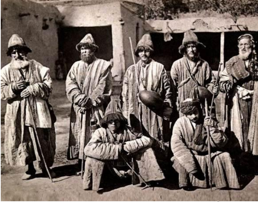
Res. 23: XX. yüzyılın başlarında Semerkant'ta Rus fotoğrafçılar tarafından çekilmiş Kalenderî dervişleri. Özellikle batılı kaynakların külahlarının ucunda at kılından mamul sert görünümlü püsküller olarak tarif ettikleri “müjgân”lar resimde görülen püsküller olmalıdır.

anlaşıyor: Sen kuşan zerrîn kemer sevdâ-yi zülfünle başa / Hayderî-veş bilüme zencîr-i ejder-ser yiter ADMK, g.35/3.