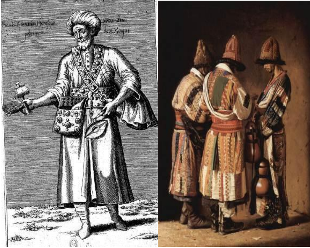
Res. 19-20: Dervişler bellerindeki kemerlere yemek kapları dahil her türlü ihtiyaç malzemelerini asabiliyorlardı. Sağda hırkaları ve müjganlı külahlarıyla Buharalı üç derviş ve bellerindeki kabakları görülmektedir.

Bu yazının muhtelif yerlerinde değişik vesilelerle abdalların meftûl takınma yahut taç takınma gibi dervişlik alametlerinin bir pir tarafından dualar ve merasimlerle verilmesine temas edilmektedir. Kemer kuşanmayla ilgili herhangi bir rivayete rastlamadık. Ancak Neccar-zâde Rızâ'nın şu beytinden taç takınma gibi kemer kuşanmanın da dervişe belirli bir çile süresini doldurduktan sonra verildiği anlaşılıyor: Tehî kalmaz miyân-i fâka hemyân-i tevekkûlden / Gehî bir çille-keş abdâl ider tâc ü kemer peydâ NRMÖ, k.1/8. Bununla beraber Gubârî'nin taç, kabâ, nal kesme ve kemer kuşanma da dahil, bütün bu abdal geleneklerinin gerçekte bir "ilgi" olması sebebiyle, bunların tamamıyla alakayı kesmek gerektiğini ifade ettiği şu beyti de ayrıca ilginçtir: Tâc ü kabâ vü na'l ü kemer hep 'alâkadur / Merd-i kalenderem ki yiter bir nemed başa PBKG, g.319/3.