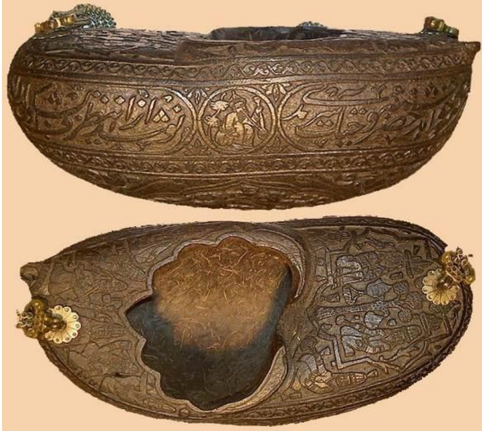
Res. 29: Keşkül-i fukarâların en basitinden en ince ve ustalıkla işlenmişine kadar türlü modelleri bugün bütün bir İslâm coğrafyasında müze ve koleksiyonları süslemektedir. Keşkül, coco-de-mer (deniz cevizi) denen bir tür ağacın dev meyvesinin birbirine yapışık iki parçasından biri olup sert kabukları üzerine ince nakış ve yazılar işlenmek suretiyle birçok sanat eseri üretilmiştir.