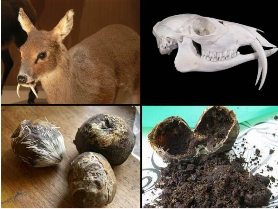
Res. 25: Misk ceylanının göbeğinden düştüğü zaman posta bürülü gibi görünmesi sebebiyle yollara düşüp sevgilinin saçının kokusunu arayan bir abdal dervişine benzetilen misk kesesi, kabuğu yarıldığı zaman siyah renkli böyle bir görünüm verir.