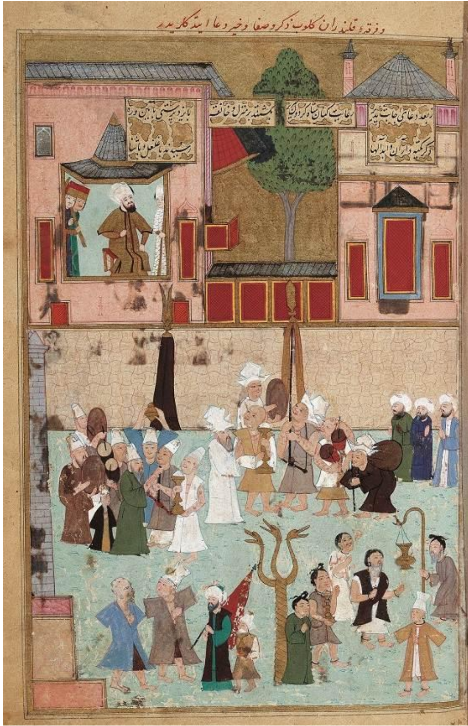
Res. 7a: Lokmân'ın Şehinşâh-nâme 'sinden alınan bu minyatürde sağ alt köşede elinde şedde çerağ taşıyan bir derviş resmedilmiş. Altta soldan 3. derviş omzunda tarikat sancağı taşıyor. Arka planda da uçlarında alemleriyle omuza bağlı askıların taşınan tarikat sancakları bulunuyor. Dervişlerin hemen tamamının vücutlarında dağ izleri görülmekte. Sol üst gruptaki dervişlerin başlarındaki beyaz taçlar, Menavino'nun "uzunluğu bir karış olan sivri beyaz bir bere" şeklinde tanımladığı külahlara uymaktadır. Arka planda ortada kahverengi tennureli dervişin elinde taşıdığı mumsuz şamdan şeklindeki nesne birçok çizim ve minyatürde (bk. res. 7b, 28) resmedilmiştir.