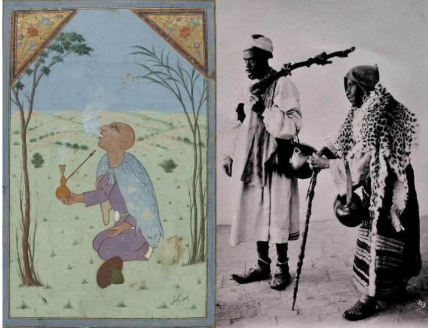
Res 9-10: Solda esrar çeken bir derviş. Sağdaki fotoğrafta omuzunda serdestesi, sırtında hayvan postu ve kolunda keşkülüyle yakın dönem abdal dervişleri.

ednâlardan ise ya pekmez ister ya ağda ve evsati-nâsdan ise 'asel-i musaffâ sevâsına düşer taşda dagda. Ammâ a'yândan ise tabî'ati şeker şerbetine ve ba'z-i helvâlara meylân ider. Ekâbir-i şâhândan ise eşribe-i mütenevvi'a fikri kendüyi bî-ser ü sâ mân ider. Pes sâyir zemânda bir heftede yimedüğü et'imeyi bir anda hõra geçirür ve bi'l-cümle gûyâ ki kısmet olunan rızkın devşürüp kendüsini dâr-i âhirete göçürür (Gelibolulu Mustafa Âlî, Mevâ'idü'n-Nefâis fi Kavâ'idü'l-Mecâlis , İstanbul 1956, İ.Ü. Edebiyat Fakültesi Yayınlarından no: 679, s.79.