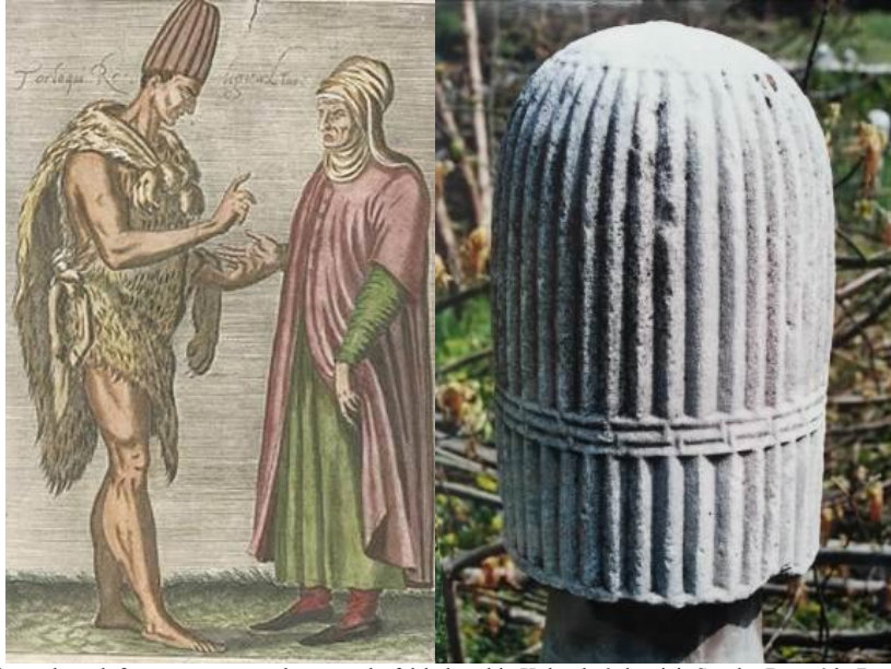
Res. 11-12: Solda: başında sadeftacı ve omuzunda postuyla fâl bakan bir Kalenderî dervîşi. Sağda: Bursa'da Bugün Arkeoloji Müzesi olarak hizmet veren Yeşil Medrese haziresinde bulunan sadeftacı bir Kalenderî mezar taşı. Bu taşın fotoğrafı daha önce Türk Ansiklopedisi'nde Abdülbaki Gölpınarlı tarafından neşredilmişti. Birkaç tane daha benzeri bulunduğunu öğrendiğim bu taşın günümüzde çekilmiş fotoğrafını lütfeden Nejdett İşli'ye teşekkür ederim.

Bununla beraber Kâtibî'nin göz bebeği etrafını çevreleyen çizgi çizgi kasları (res. 26) kırk dilimli Kalender tacına benzettiği şu beyti, "Kalender tacı" ile "tâc-i sadeft" in gerçekte aynı taş modelinin ismi olduklarını tereddüte mahal bırakmayacak derecede göstermektedir: Gözleri misli-kalender urunup tâc-i siyeh / 'Anberîn turesi câmi gibi indirdi fetil ENMN, g.2846/3. Hisâlî'nin Metâlî'ü'n-Nezâir' inde yer verdiği Ümîdî'nin şu matlaında görüldüğü üzere "sadeft taş" veya "Kalender tacı" aynı bir zambak tomurcuğu (res. 16) görünümü arz etmekteydi: Başda külâhı zanbakun tâc-i kalender kendidür / Destinde şâh-i goncanun heft-ser-i ejder kendidür HMNB, b.5634.