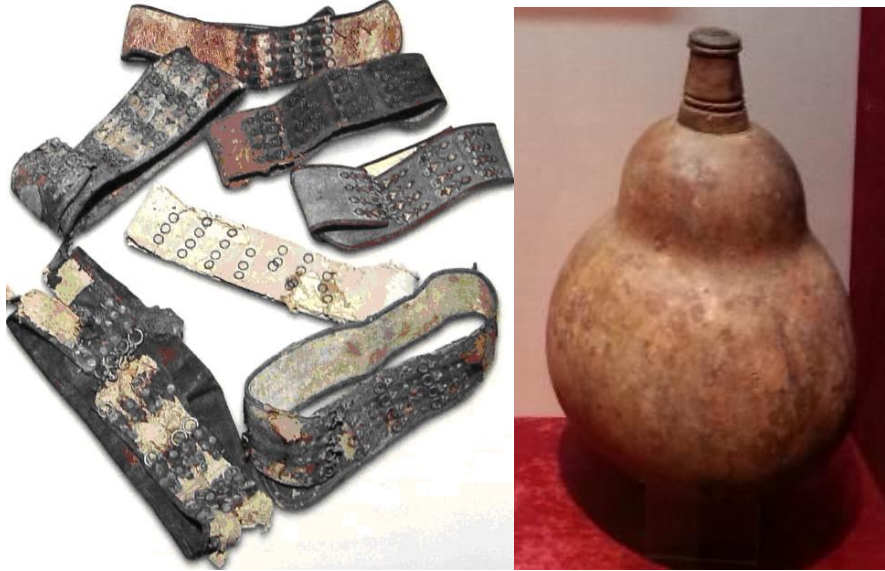
Res. 17-18: Tekke ve zaviyelerin lağvından sonra İstanbul Vakıflar depolarına aktarılan tarikat kemerlerinden Kâdirîlere mahsus gayret kemerleri. Bunlar üzerindeki 12 kanca ve onlara karşılık gelen halkalar dikkat çekici olup, Kalenderî kullaplarının da bu halka ve kancalarla bağlantısı bulunabileceği hususunda bir ipucu oluşturabilir düşüncesiyle buraya alındı. Sağda dervişlere mahsus su kabağından mamul matara. Bu kabaklar 20 numaralı resimde görüldüğü üzere bele takılarak taşınıyordu.

Eski metinlerde birçok anlamda kullanılan “kullâb” kelimesinin Hayderî ve Kalenderî dervişlerinin bellerine taktıkları ve üzerinde “cür‘a-dân” vb. malzemelerini astıkları zincir şeklindeki kemerler için de kullanıldığı anlaşılmaktadır. Yine metinlerde görüldüğü kadarıyla aslında “kullâb” kelimesi kemerin diğer ucundaki halkaya geçirilmek üzere tasarlanmış kancanın adıdır. 38 Öyle anlaşılıyor ki zamanla bu tabir “kemer” ve özellikle üzeri kancalarla dolu “abdâl kemeri” karşılığında kullanılır olmuş. Mesela Âşık Çelebi'nin Meşâirü 'ş-Şu'arâ' sında Hayâlî Beğ'in şeyhi Baba Ali Mest-i Acemî'nin kemerinden bahsederken sarfettiği “belindeki ejder başlı kemerini beden hazinesine tılsım eylemiş” anlamındaki miyân-bendindeki kullâb-i ejder-seri tılsım-i genc-i vücûd eylemiş , 39 ifadesinden de anlaşılacağı üzere “kullâb” burada mutlak anlamda abdâl dervişlerinin bellerine kuşandıkları kemer veya zincirin adıdır. Nitekim Mahremî'nin Baba Ali Mest-i Acemî'nin kemeri gibi “iki başlı ejder” modeli bir kemeri tasvir ettiği şu beytindeki “kemer” ve “kullâb” kelimeleri de eşanlamlı kullanılmıştır: Kemer-bendiyle kullâb-i kemer hem / Dü ser ejder-durur bend içre muhkem MŞHA, mes.1261.