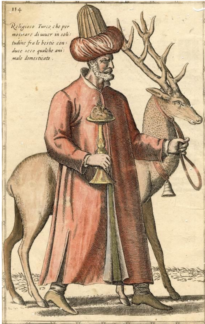
Res. 28: Arslan, kaplan, geyik ve ceylan gibi hayvanları ehlileştirerek yanlarında gezdiren dervişlerden birini tasvir eden bu çizimde dervişin elinde gezdirdiği ve pek çok minyatürde çizimine rastlanan (bk. res. 7a, 7b) şamdan şeklindeki nesne dikkat çekicidir.

Abdallarla arslan ve kaplan yahut geyik ve ceylanların birlikte bulunmaları yabancı seyyahların çok ilgisini çekmiş olmalı ki bunları çoğu zaman yanlarında bir geyik yahut ceylanla birlikte çizmişlerdir. Anadolu’da bugün “Geyikli Baba” ismiyle birçok yadır ve türbe bulunması da ömürleri dağ-tepe seyahatle geçen bu dervişlerin gezileri sırasında bulup kendilerine alıştırdıkları ve şehirlere girdiklerinde birlikte gezdirdikleri bu hayvanlarla anılmaları sebebiyle olsa gerektir. Emrî bir beytinde vahşî hayvanlarla yaşayan Mecnûn’u bu kabil bir abdal dervişine benzetirken o devirde çokça rastlanan bu manzarayı ima etmektedir: Ey saçı Leylî senüñ gam şâhı Mecnûn didüğüñ / Bir niçe âhûleri var idi bir abdâl idi EDYS, g.522/2. Pîrleri Kutbüddîn Hayder-i Zâveî’ye nispetle (ö. 618/1221) Hayderîler olarak anılan Kalenderîlerin bir kolu “hayder” kelimesinin arslanı ve Hz. Ali’yi çağrıştırması sebebiyle şairlerce özellikle arslanla birlikte anılırlar. Bunların aksesuarları arasında zincirlerin bulunması da arslanların zincirle zaptedilmeleri bakımından tam bir uyum sağlamaktadır. Emrî’nin şu beyti Hayderîlerle arslan ve zincir ilişkisini gösteren pek çok örnekten biridir: Cism-i zerdüm bend idüp zencîr-i âhumla göñül / Hâneme bir hayderî-veş cerre geldi şîr ile EDYS, g.446/4