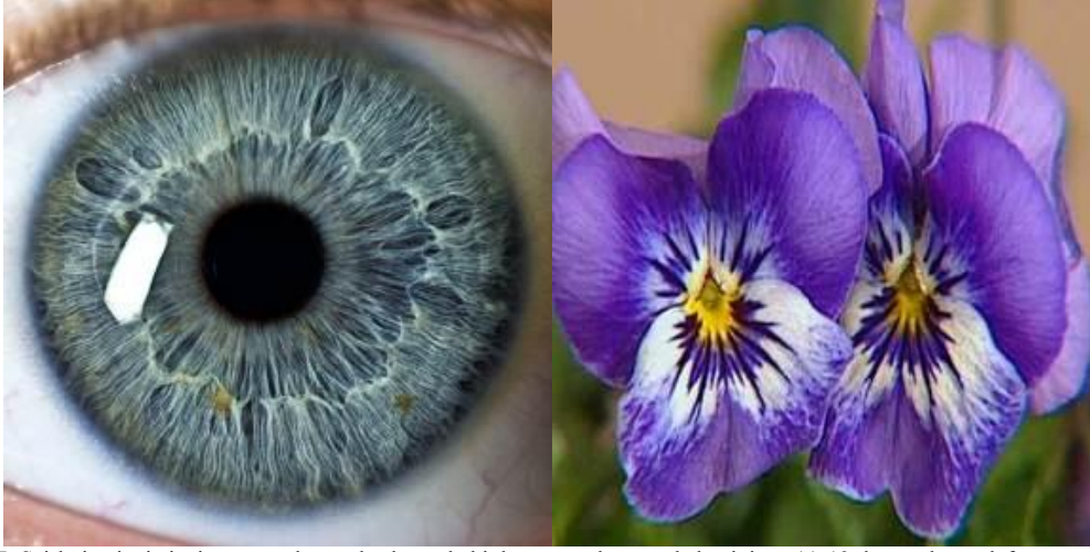
Res. 26-27: Şairlerin çizgi çizgi görünümlü göz kasları sebebiyle gözü yahut göz bebeğini res.11-12 de görülen sade taç veya Kalenderî tacı denen kırk dilimli taç giymiş bir dervişe benzetmeleri, eserlerini ne kadar ince gözlemler sonucu nazmettiklerini gösteren ipuçlarından biri olarak değerlendirilebilir. Sağdaki resimde görülen menekşenin ortası da yine kırk dilimli Kalenderî tacına benzemesi sebebiyle bu çiçek hakkında da serpuşlarla ilgili birçok yorum geliştirilmiştir.