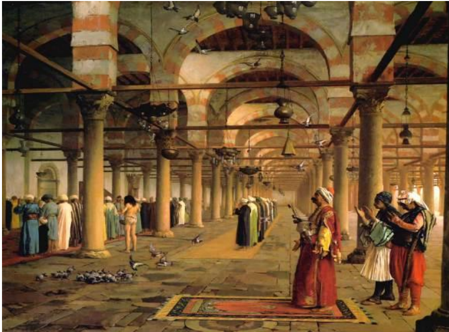
Res. 1: Jean Leon Gerome'un (ö. 1904) Kahire Kayıtbay Caminde namaz kılan cemaat tablosuna yerleştirdiği, elinde keşkülüyle uzun saçlı çıplak bir derviş resmi. Ömrü korumasızca güneş altında geçen bir dervişin esmer tenli cemaat arasında bu derece açık tenli resmedilmiş olması, sanatkârın bu dervişlerin hayat tarzlarını bilmemesinden kaynaklanıyor olmalıdır. Bununla beraber resmin bizim açımızdan önemli tarafı, abdal zümrelerinin XIX. yüzyıl sonlarına kadar Kahire sokaklarında dolaştığının tespitidir.

İlginç olan şudur ki: Safevî propagandası yaptıkları ve bâtinî inançları yaydıkları gerekçesiyle devletten baskı gören bu abdal ve Kalenderîler, aynı zamanda şiir sanatının temelini oluşturan "âşık" tipinin en ideal modeli olarak görülüyorlar ve şiir geleneği icabınca padişahlar dahil bütün şairlerce sofu tipine karşı riya kirinden arınmış bir kahraman olarak alkışlanıp övülüyorlardı. Fatih ve Kanunî gibi hükümdarların kendilerini şiirlerinde sürekli yalın ayak başı kabak diyar diyar dolaşan, içip yollarda sızan bir Kalender dervişi gibi tasavvur etmeleri, bu ilgi ve rağbetin en çarpıcı göstergelerindendir. Celâleddîn-i Rûmî'nin Mesnevî 'sinde, aktar dükkânına dilenmek için giren Cavlâkî/Kalenderî dervişi ile papağan hikâyesinde dervişin ehl-i irfanı; onu gülyâğı şişelerini devirmiş sanan papağanın ise -irfan ehlinin manevî hallerini anlamayan- "kuş beyinli" avamı temsil etmesi, Kalenderîlere XIII. yüzyıldan tarih sahnesinden silindikleri güne kadar gösterilen ilgi ve itibarı yansıtmaması bakımından önemlidir.