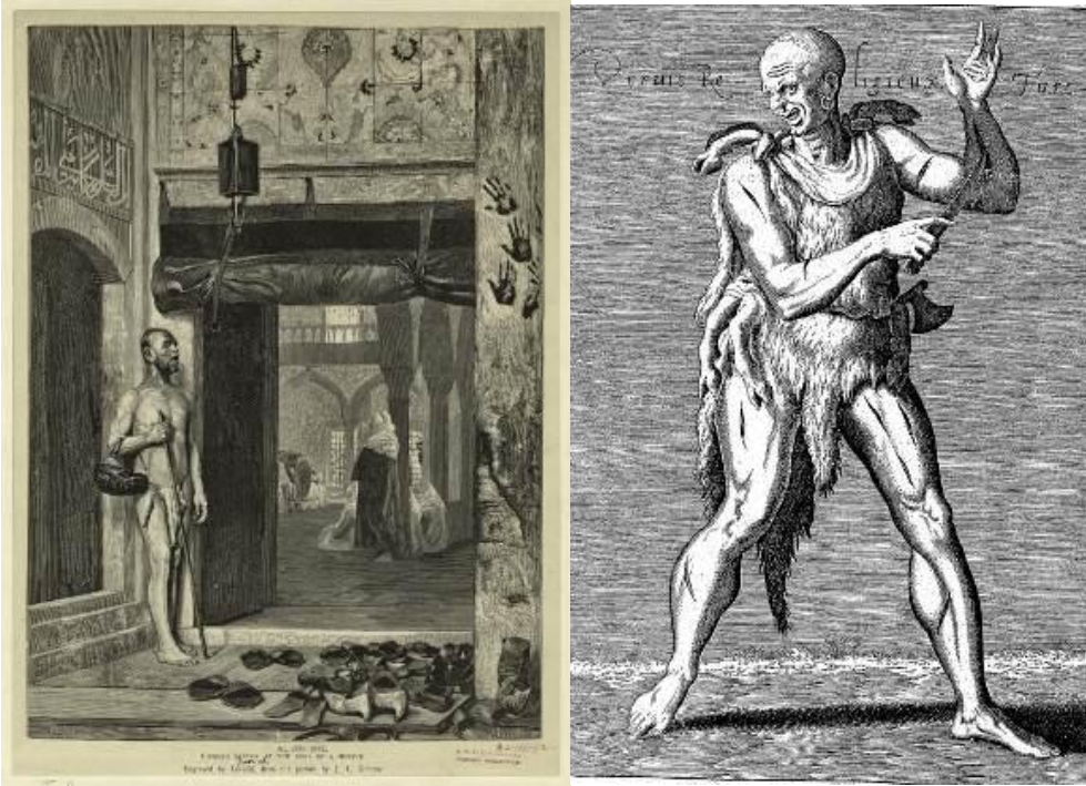
Res. 4-5: Gérôme, Jean Léon'un 1881 tarihli Cami kapısında dilenen Kalenderî dervişi tablosu. Sağdaki çizim Nicolas de Nicolay'ın Navigation'undan alınmış. Sirtında postu, belinde teberiyle elif çeken bir Kalenderî dervişi.