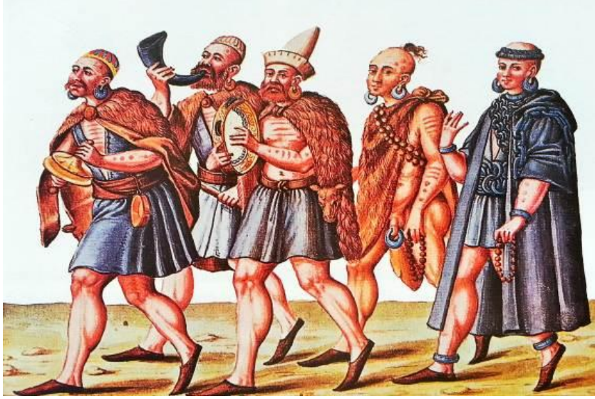
Res. 8: Johannes Lewenklau'un yaklaşık 1586'da çizdiği Viyana Codex Vindobonensis 8615'te kayıtlı albümdeki gezginci dervişler.

Kendisi de bir esrar müptelası abdal derviş olan Hayretî'nin şu beytinde esrar çektikten sonra gelen neş'e ve gayri ihtiyari gülme duygusu çok ustaca dile getirilmiştir: Niçe bir zülfi gibi hâk ile yeksân olalum / Niçe bir turraları gibi perişân olalum / Açılalum leb-i dilber gibi handân olalum / Cür'adânı getir abdâl yine hayrân olalum HDMÇ, mus.13/1.