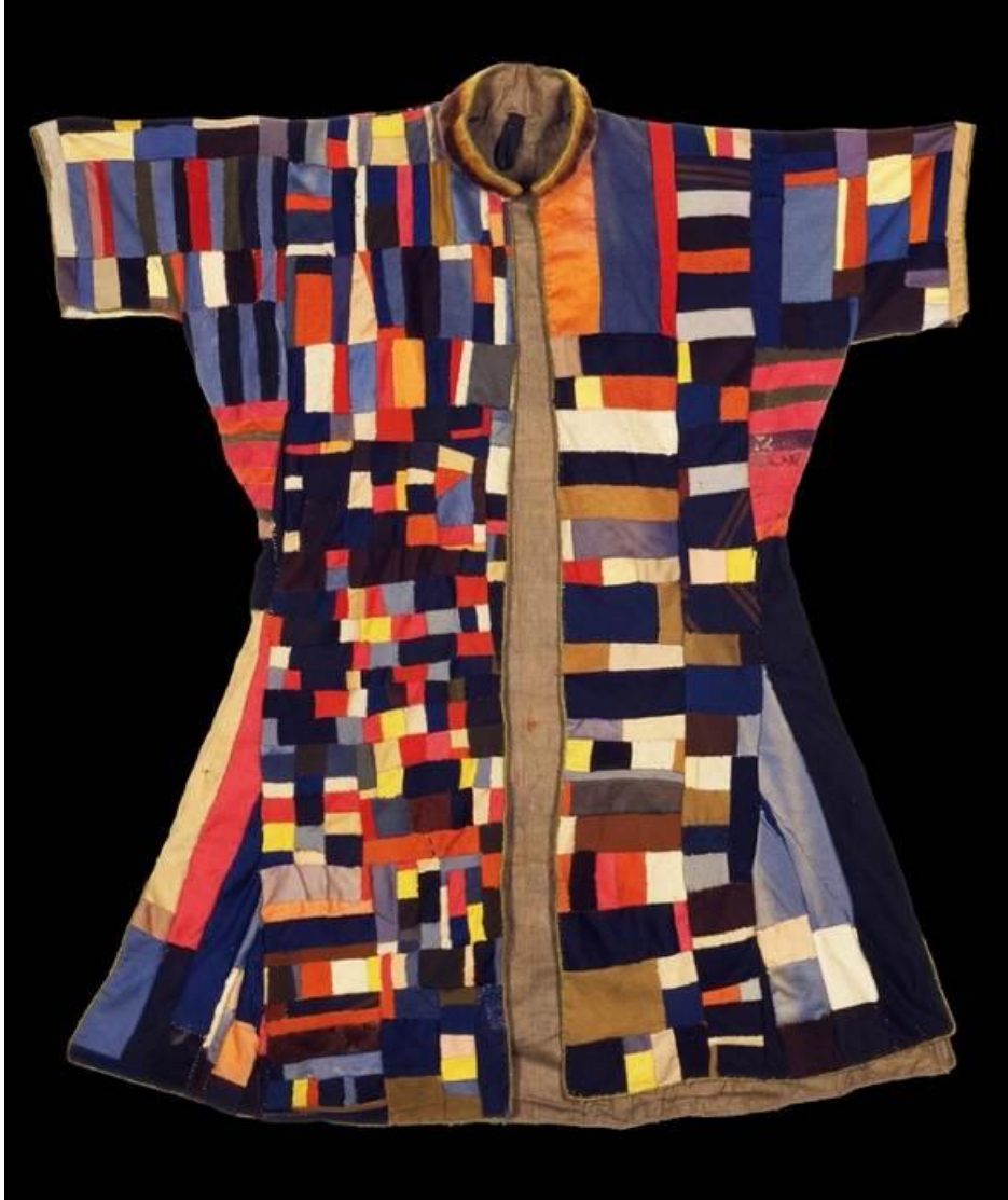
Res. 30: XIX. Yüzyıl ortalarına ait İran menşeli bir derviş Hırkası. Berlin Devlet Müzesi, Julius Heinrich Petermann Koleksiyonu 1857.