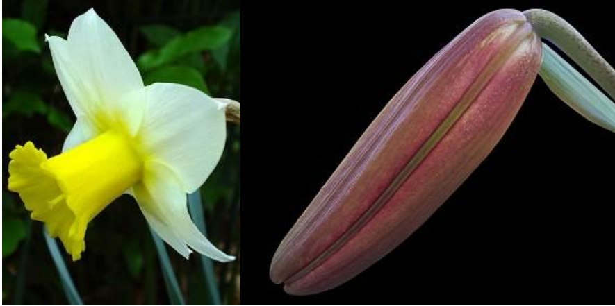
Res. 15-16: Beş beyaz parmağı andıran alttaki taç yapraklarıyla üzerinde altın bir kadeh şeklinde duran sarı taç yaprakları sebebiyle nergis edebî metinlerde “zerrîn kadeh” adıyla da anılır. Bu resimde görüldüğü üzere bu altın taç yaprakları bir Kalenderî dervîşi külahı şeklindedir. Aynı şekilde yandaki zambak tomurcuğu da uzun kırk dilimli sadef Kalenderî tacını andırmaktadır.