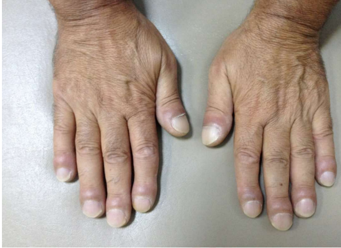
Resim 1. Çomak Parmak görünümü

Ağustos 2014' te her iki alt ekstremitede ağrı ve sağ dirsekte şişlik şikayeti ile polikliniğimize başvuran 52 yaşındaki erkek hastanın yapılan fizik muayenesinde çomak parmak (Resim 1) ve sağ dirsekte bursit tespit edildi.