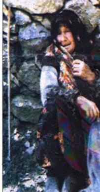
'YAŞAMAK İSTEMİYORUM' diye yalvarıyordu, bir vahşetle tanışan aile, ailesizliği göremenin acısıyla, çöküp kaldığı duvar dibinde boğazını: 'Beni de öldürün. Artık yaşamak istemiyorum'

GÖRÜLMEMİŞ VAHŞET Son günlerde artan PKK saldırıları, karakol baskınları, birçok askerin şehit olması ve Sivas'ta 36 kişinin ölümlü yakılması ile sokağın Türkiye, dün yeni bir katliam haberiyle ailek bulak oldu. Önceki akşam, Erzincan'ın Kemaliye ilçesi Başbağlar köyünü basan PKK'lı canlılar, 28 kişiyi kurşuna dizdi, biri çocuk biri kadın, dört kişiyi evleriyle yakarak katletti