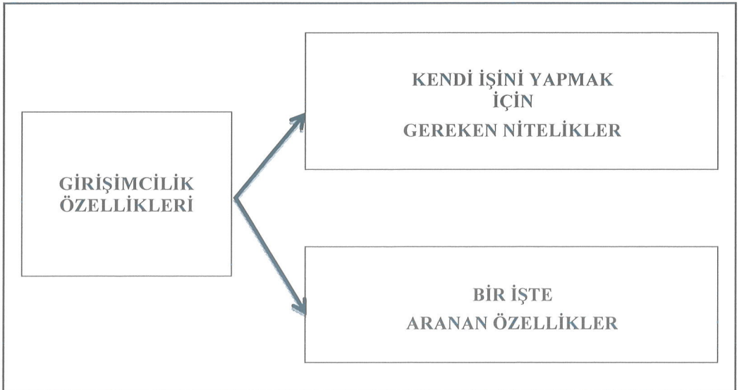
Şekil 1. Araştırmanın Kavramsal Modeli

Bu çalışmada makro ekonomik gelişimin önemli bir unsuru olarak tanımlanan ve görülen girişimcilik özelliklerinin, üniversite öğrencileri arasında nasıl algılandığı ve bu alana ne kadar yöneldikleri araştırılmıştır. Üniversite öğrencilerinin girişimcilik özelliklerinin belirlenmesi ve üniversite öğrencilerinin kişisel özellikleri ile aldıkları eğitimin girişimciliğe etkisinin olup olmadığı araştırılması konusunda yapılan araştırmada önce literatür de yer alan girişimcilik tanımları, girişimcilik tipleri, girişimcilik eğitimi ve girişimcilik eğilimleri konularının üzerinde durulmuştur. Araştırmanın kavramsal modeli Şekil 1’de görülmektedir: